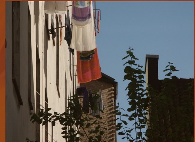
"Greetings to Napoli" - Juli 2004 - San Pauli - Wohlwillstrasse